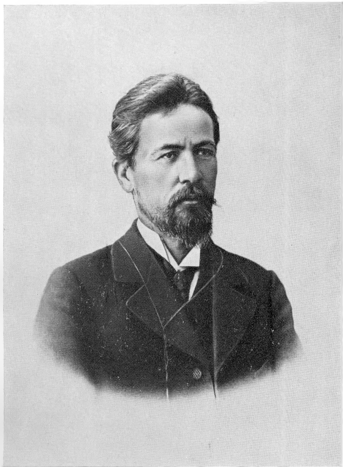
А. П. ЧЕХОВ 1899 г. Фотография.